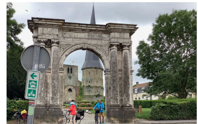
Bergues : la porte de Marbre de l'abbaye Saint Winoc