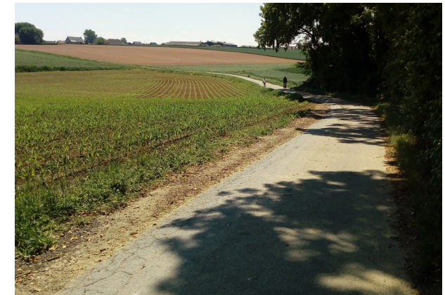
Petites routes des Flandres entre Caëstre et Esquelbecq