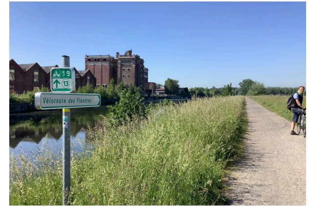
Armentières : les bords de la Lys