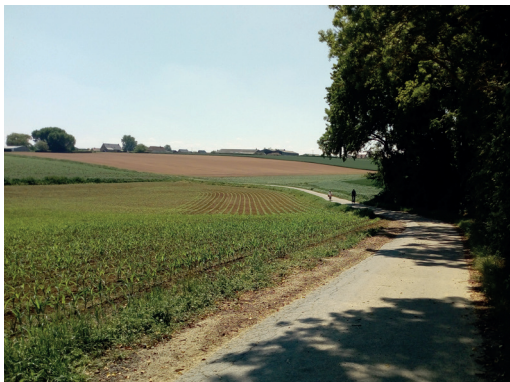
Petites routes des Flandres entre Caëstre et Esquelbecq