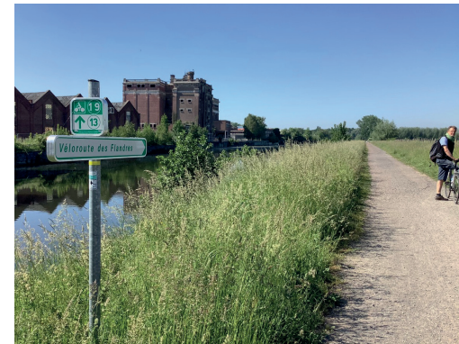
Armentières : les bords de la Lys