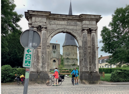
Bergues : la porte de Marbre de l'Abbaye Saint Winoc